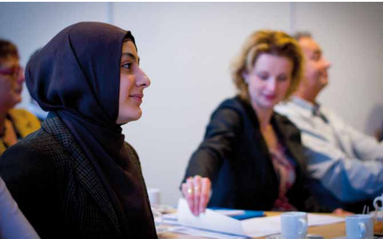
Bijeenkomst van migrantenorganisaties, jeugdinstanties en gemeente in Roermond.

De migrantenorganisaties die in de verschillende gemeenten uit de bus kwamen, voldeden alle in meer of mindere mate aan dit profiel (zie de kadertekst op volgende pagina).