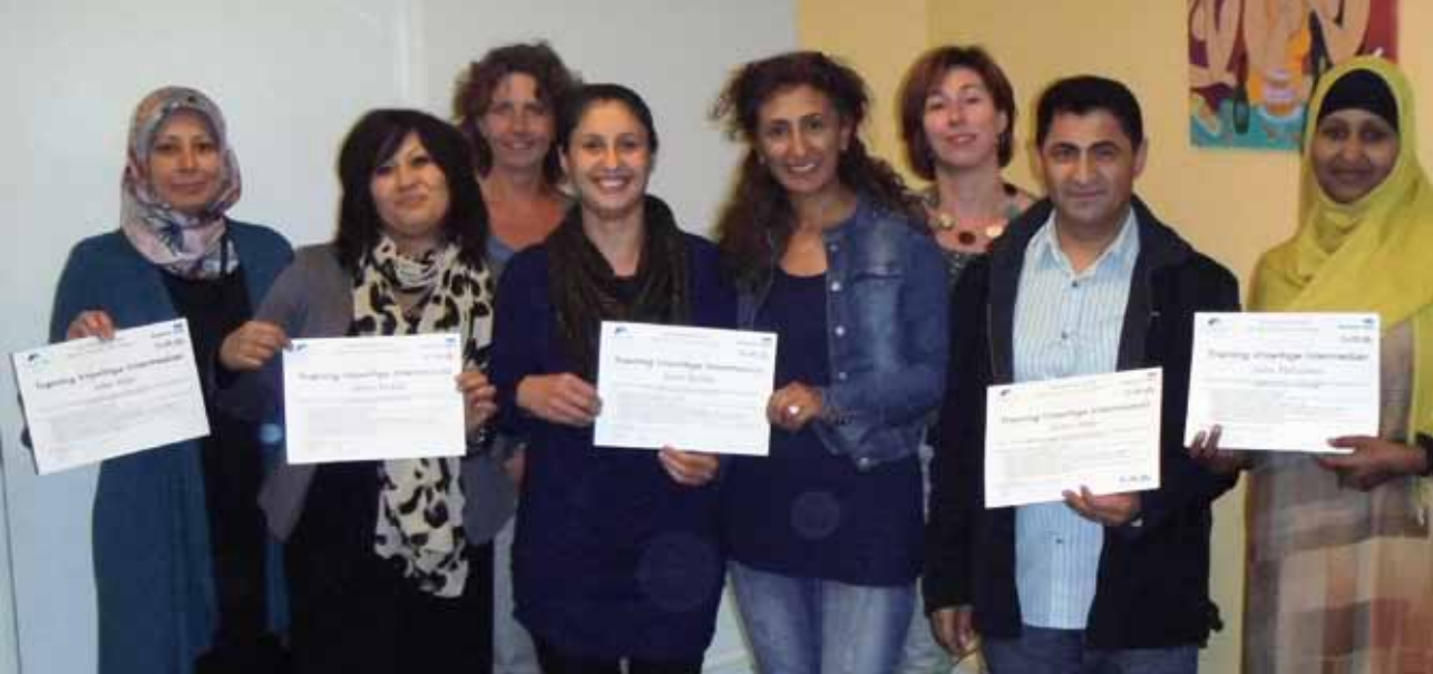
Intermediars in Delft tonen hun zojuist ontvangen certificaat.