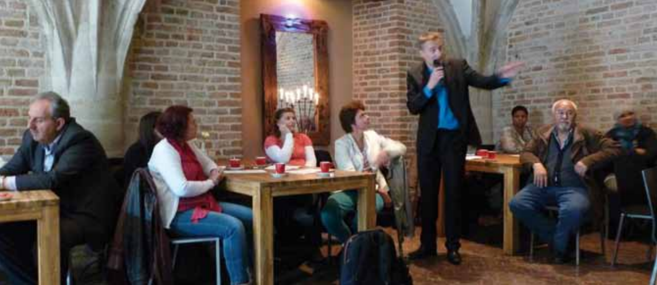
Zaaldiscussie tijdens een bijeenkomst in Dordrecht.

urgentie daarvan aan te tonen. Cijfers liggen helaas niet altijd voor het opscheppen. Want lang niet altijd worden jeugdhulpcliënten geregistreerd naar herkomst. Toch zijn er wel mogelijkheden om zicht te krijgen op het bereik van de jeugdvoorzieningen. Bijvoorbeeld door teamleiders te vragen naar een gefundeerde schatting. De jeugdgezondheidszorg kan de Gemeentelijke Basisadministratie (GBA) gebruiken en wél cijfers naar herkomst leveren door de naam van de cliënt te koppelen aan de geboorteplaats, die in de GBA geregistreerd staat. Maar wat zeggen die cijfers? Een mooi bereik van bijvoorbeeld de consultatiebureaus betekent nog niet dat er voldoende ouders bij de opvoedingsondersteuning terecht komen.