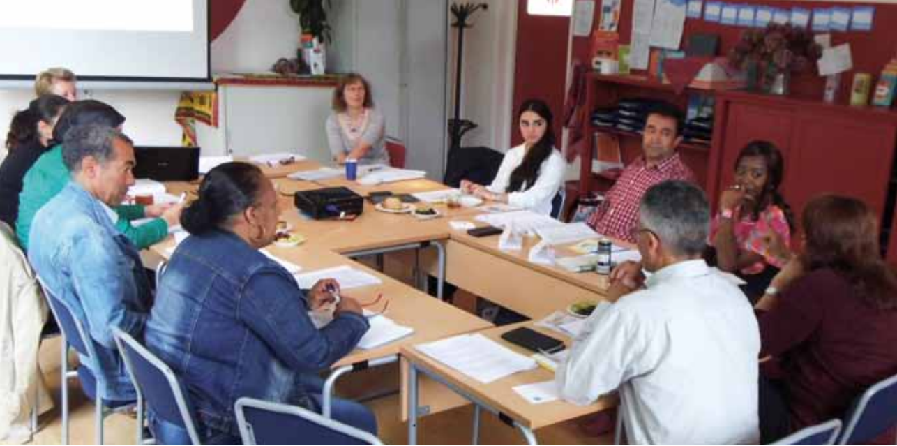
Training van intermediairs in Dordrecht.