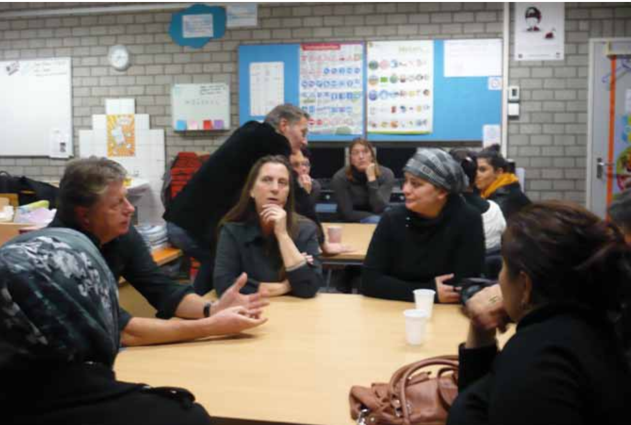
Cursus voor ouders op een basisschool in Dordrecht.

Een begrijpelijk dilemma is dat scholen graag een specifieke doelgroep extra aandacht wil geven, maar deze aan de andere kant niet apart wil zetten. De cursus (of ouderavond) dan maar aan alle ouders aanbieden, is niet zo'n geschikte oplossing. Bepaalde ouders zullen zich door de stof niet aangesproken voelen of de voorlichting overbodig vinden. Beter is daarom om de doelgroep persoonlijk uit te nodigen en goed uit te leggen waarom deze cursus, of ouderavonden, juist voor hen belangrijk zijn.